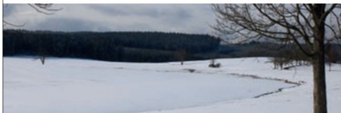
Schülerzeitung „Durchblick“, Winterausgabe 2020, Titelseite

SCHÜLERZEITUNG „DURCHBLICK“ - PERTHES GYMNASIUM FRIEDRICHRODA