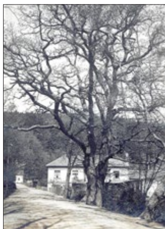
Schönauer Straße um 1910 mit der Eiche, die 2020 gefällt wurde

1909 gab Pfarrer Baethcke in der Nummer 100 der „Heimatgrüße aus Georgenthal im Herzogtum Gotha“ zu den Eichen an der Schönauer Straße folgende Mitteilung der herzoglichen Forstmeisterei wieder: „An der östlichen Böschung des Hammerteichdammes hier stehen drei sehr schöne, starke Eichen mit mächtigen Kronen, welche der ganzen Umgebung zur größten Zierde gereichen.“ Auch erwähnte Pfarrer Baethcke in seinem Beitrag die weite Verbreitung der stolzen Bäume in Georgenthal: „... die anderen, ebenfalls um 1600 gepflanzten altherwürdigen Eichen, z.B. auf unserem durch sie so besonders schönen Friedhof, in der Aue und in dem Geheimrat Dr. Purgold'schen Besitz 1) ...“ Weiterhin gab Pfarrer Baethcke seiner besonderen Hoffnung Ausdruck: „Möge nie die Axt unserm Ort diese Sehenswürdigkeiten zerstören ...“