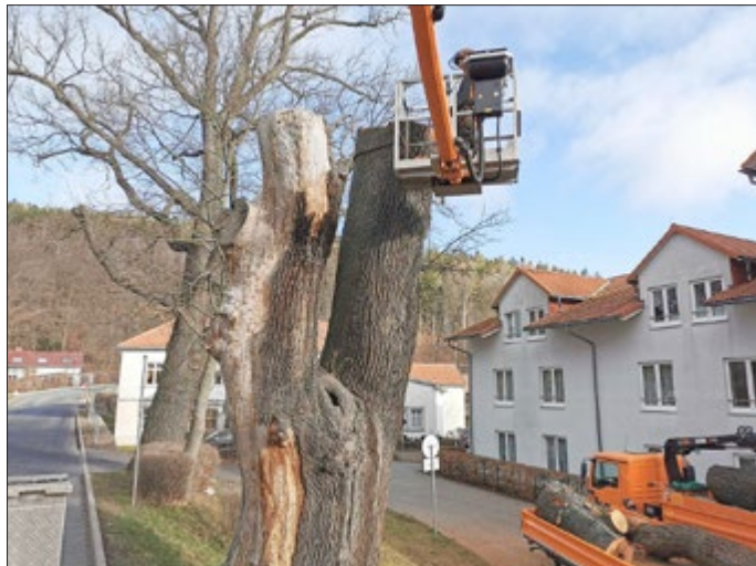
Baumfällung an der Schönauer Straße, 4. März 2020

Weitgehend unbeachtet ist am 4. März d.J. eine der über 400 Jahre alten Eichen an der Schönauer Straße in Georgenthal gefällt worden.