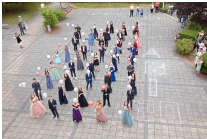
Die Schule wünscht ihnen für diesen neuen Lebensabschnitt alles Liebe und Gute.