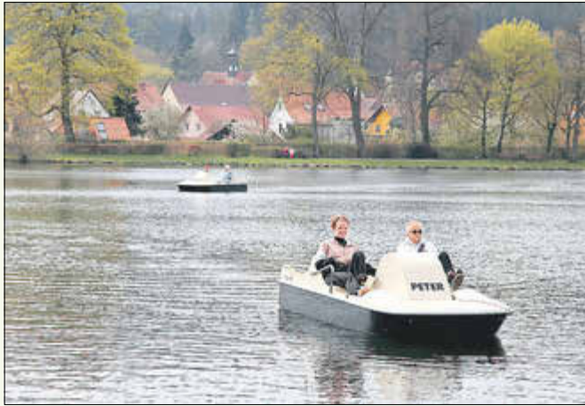
Die neuen Boote „Siggi“ und „Peter“ laden nun Gäste und Einheimische zu einem Ausflug zu Wasser an einem der schönsten Plätze Georgenthals